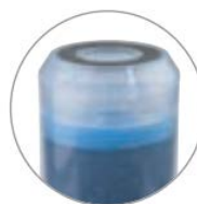
Charbon actif granulaire