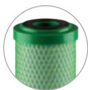
Bloc de carbone