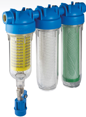
RAINMASTER TRIO RAH-CB Code : 491185

Filtres triples pour les eaux de récupération pluviale