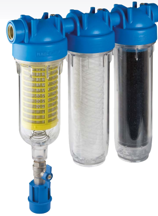
RAINMASTER TRIO RAH-LA Code : 491186