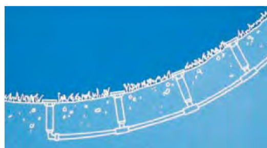
Avec clapet anti-vidange

plates-bandes de fleurs en pente ou sur terrains accidentés ou exposés au vandalisme.