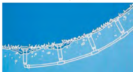
Sans clapet anti-vidange