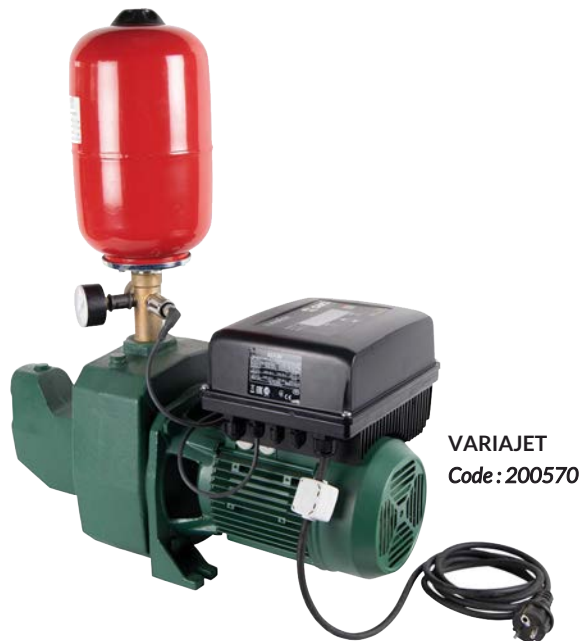
VARIAJET Code : 200570