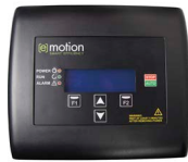
Variateur E-MOTION M/T 2-11