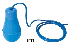
IFB Régulateur de niveau