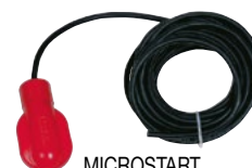
MICROSTART Interrupteur de niveau