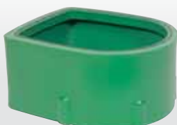
Réhausse (hauteur 300 mm) code : 453018